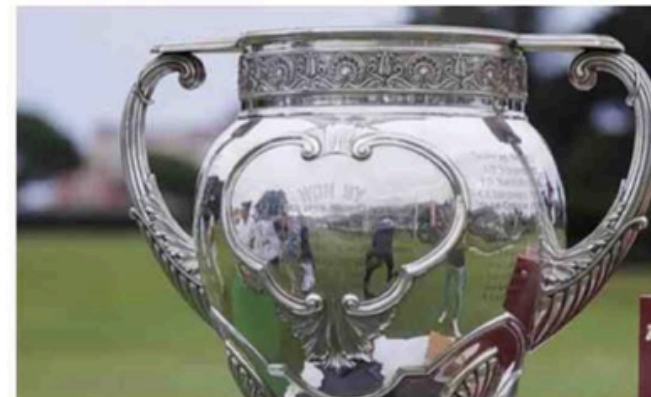
Pour la première fois, la Biarritz Cup pourrait atterrir dans les mains d'un professionnel. N.C.

amateur, avec 36 joueuses. Remportée l'an passé par Emma Falcher, elle se jouera en trois tours avec un cut au bout de deux jours. Une seconde série féminine est également prévue. La Biarritz Cup se distingue par son ouverture aux amateurs de tous niveaux. En plus de l'épreuve principale, deux compétitions annexes, la Town Cup et le Trophée, accueilleront respectivement les index de 0 à 6,9 et de 7 à 16, offrant à chacun la possibilité de jouer dans des conditions similaires aux grands tournois professionnels. Ces formats devraient débiter à partir du 19 juillet. Nathan Cardet